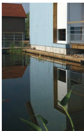
Gîtes au Port de la Jonction à Decize arch. M. Perrin & B. Recoules