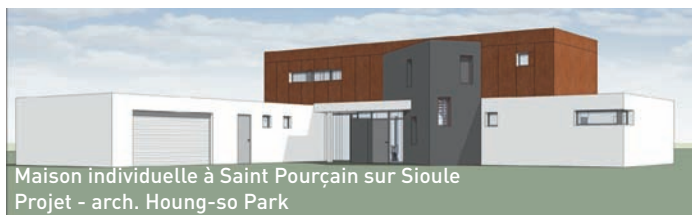
Maison individuelle à Saint Pourçain sur Sioule Projet - arch. Houg-so Park

Ses mises en garde sont le plus souvent adressées par écrit. Sur chaque réalisation, l'architecte engage sa responsabilité et sa réputation.