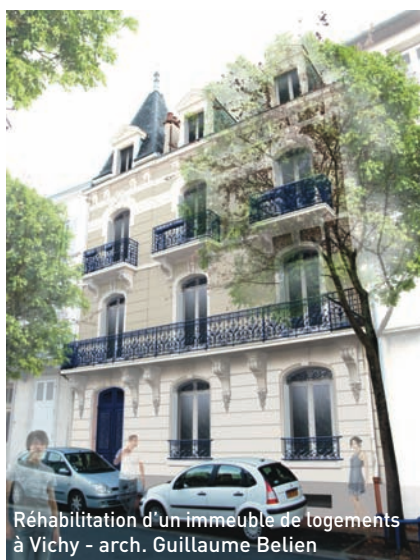
Réhabilitation d'un immeuble de logements à Vichy - arch. Guillaume Belien

La vocation de l'architecte est de participer à tout ce qui relève de l'aménagement de l'espace et plus particulièrement de l'acte de bâtir