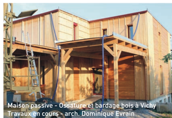
Maison passive - Ossature et bardage bois à Vichy Travaux en cours - arch. Dominique Evrain