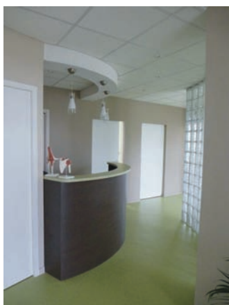
Aménagement d'un cabinet de kinésithérapie à Bellerive / A. arch. Emmanuel Possamai

Le non-respect de ces règles peut entraîner des sanctions disciplinaires (avertissement, suspension, radiation).