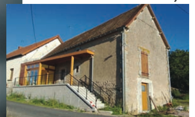
Réhabilitation d'une maison ancienne Travaux en cours arch. Charles Coulanjon