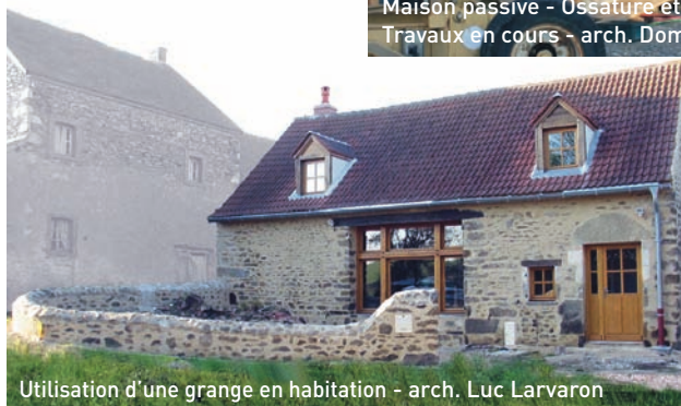
Utilisation d'une grange en habitation - arch. Luc Larvaron

L'architecte intervient sur la construction, la réhabilitation, l'adaptation des paysages, des édifices publics ou privés, à usage d'habitation, professionnel, industriel, commercial, etc.